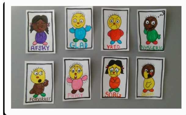
Opgave 1.2. Humørkort –sæt ord på følelserne

Lad deltagerne fremstille deres egne humørkort ud fra en samtale om, hvordan ser man ud, når man er sur, glad, overrasket mv.