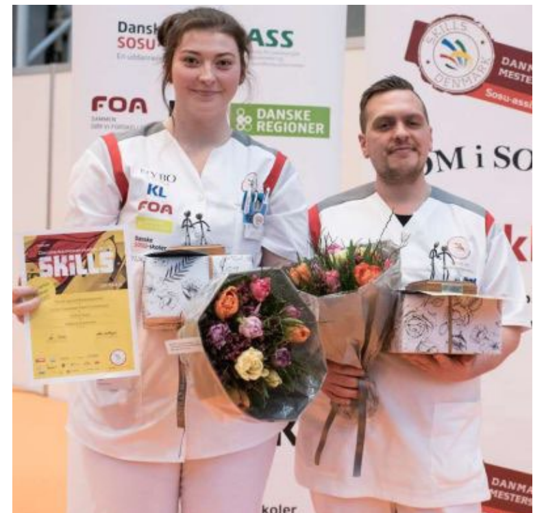
Vinderne af DM i SOSU 2020.

Læs her i folderen om, hvordan det foregår.