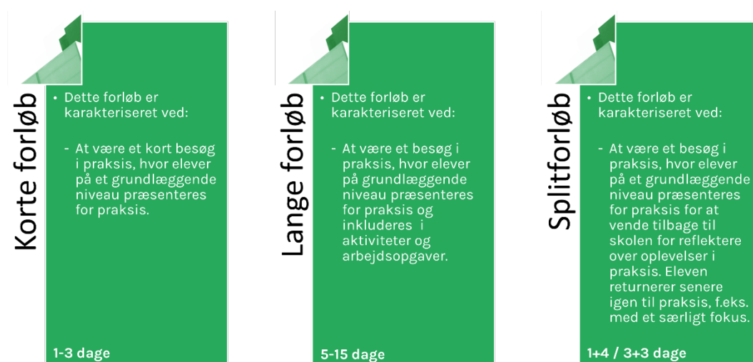
FIGUR 2: MODELLER FOR VIRKSOMHEDSFORLAGT UNDERVISNING

Skolerne anvender forskellige modeller for den virksomhedsforlagte undervisnings tilrettelæggelse og længde. Nedenfor er skolernes brug af virksomhedsforlagt undervisning sammenfattet til tre modeller for VFU-forløb, som ligeledes giver en generel karakteristik af forløbene: