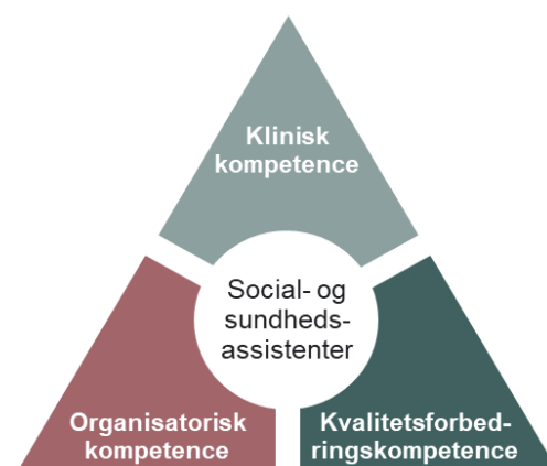
Figur 1. Illustration af kompetencemodellen