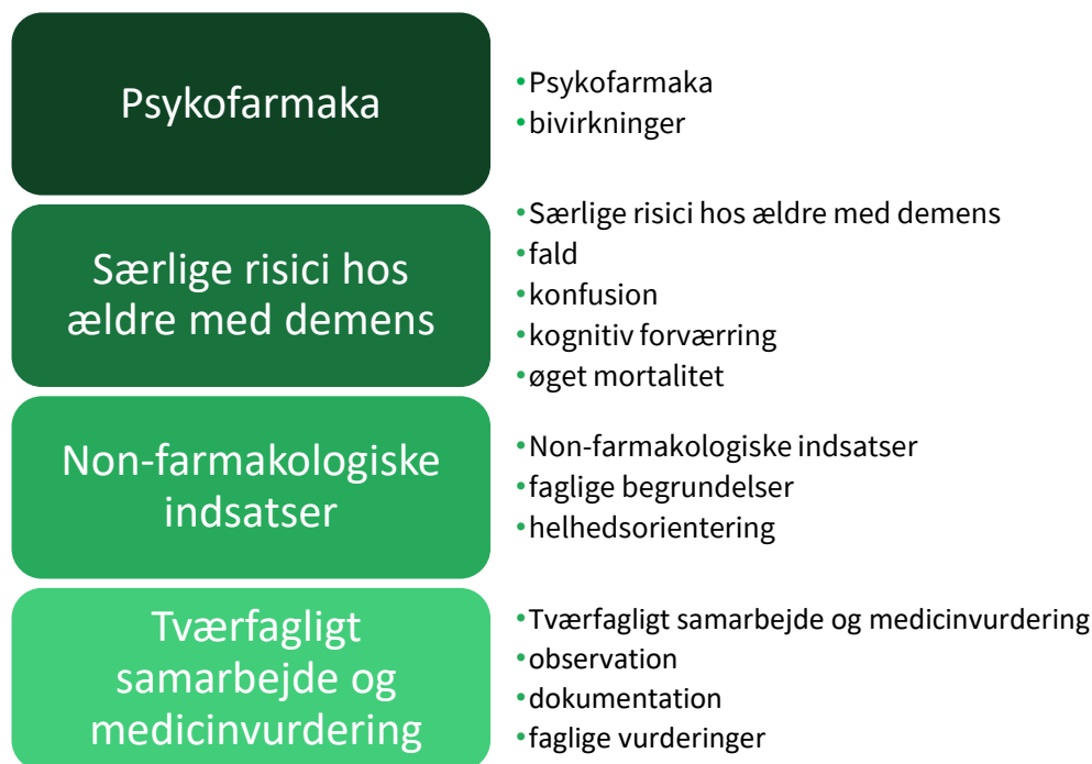
Figur 2: Oversigt over temaer og emner

Efterfølgende beskrives temaer og tilhørende emner uddybende.